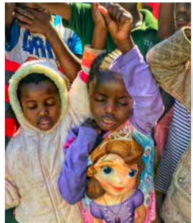
Il y a une faim de Dieu incroyable parmi les enfants dans les écoles.