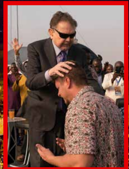
Fürbitte mit Hunderttausenden Betern

Zahlreiche Gemeinden aus der Nähe des von uns genutzten Feldes haben sich mittlerweile zusammengefunden und halten dort jede Woche große Gebetstreffen ab. Die Menschen strömen förmlich zu diesen Treffen, auch, weil sie von den vielen Berichten über Heilungen und Wunder, die dort immer noch stattfinden, angezogen werden.