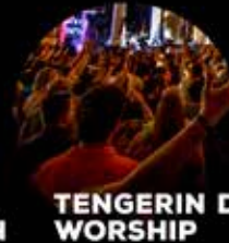
TENGERIN DOO WORSHIP