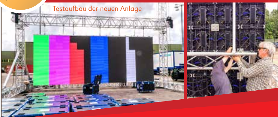
Testaufbau der neuen Anlage

Jeder Euro, jeder Franken wird dringend gebraucht.